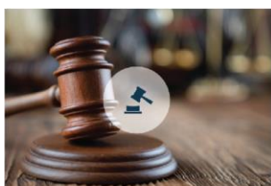
Pravosuđe i socijalna zaštita