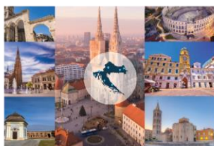
GIS i subnacionalne statistike