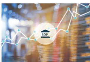
Bruto domaći proizvod, nacionalni računi, investicije i financije