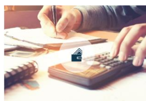
Životni uvjeti, dohodak i socijalna isključenost