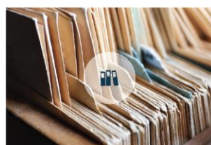
Registar poslovnih subjekata