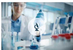
Znanost, tehnologija i informacijsko društvo