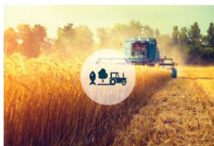
Poljoprivreda, šumarstvo i ribarstvo