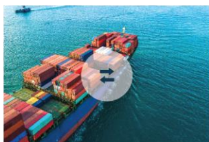
Robna razmjena s inozemstvom