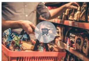
Trgovina i ostale usluge