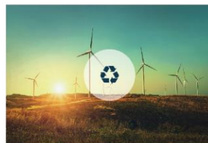
Okoliš, gospodarenje otpadom i energija